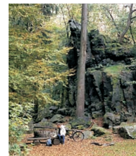
Wilhelmsteine bei Wallenfels

Weitere Informationen bei TOuR GmbH Marburg-Biedenkopf Im Lichtenholz 60 35043 Marburg/Lahn Telefon: 0 64 21/40 53 45 Fax: 0 64 21/ 40 55 09 e-mail: Tourismus@Marburg-Biedenkopf.de